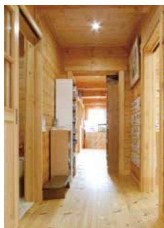
玄関と1階各室をつなぐ廊下。