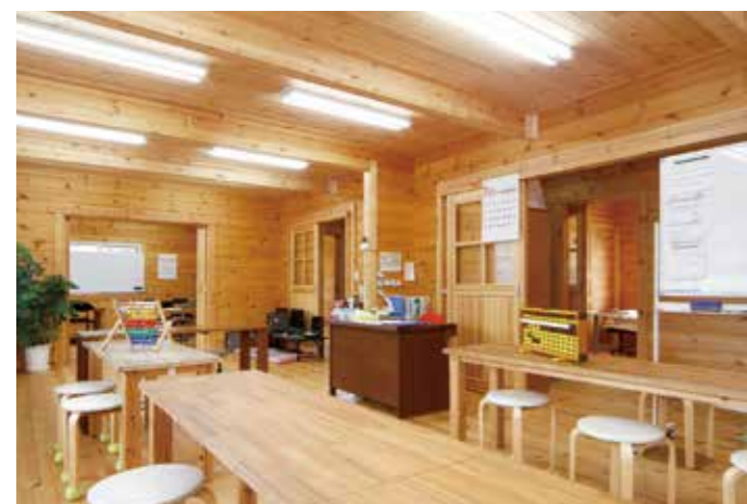
幼児クラスの教室。ここで読み、書き、計算を学ぶ。