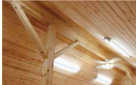
棟木が貫く大屋根の構造に子どもたちも興味津々？