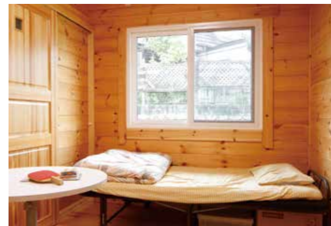
相談室。親御さんとの相談や気分が悪くなった子の救護室として使う。