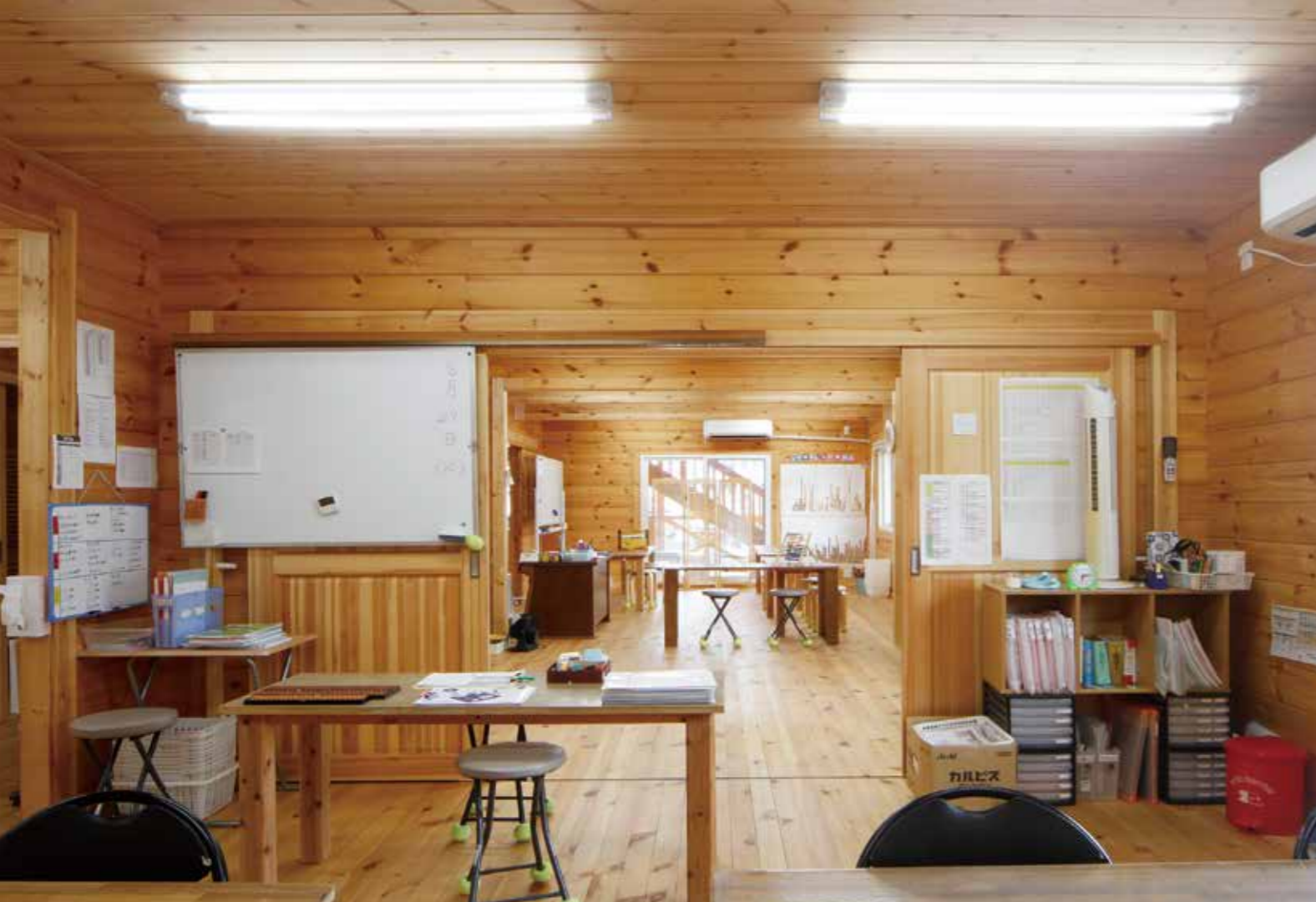
小学生クラスの教室から幼児クラスの教室を見る。一続きになる開放感は、古民家の大広間を彷彿とさせる。