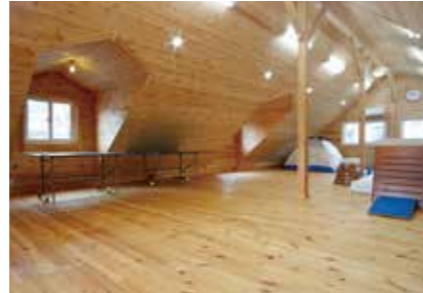
2階の全面が体操室として使われる。