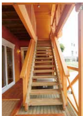
外階段にして2階体操室を広くした。