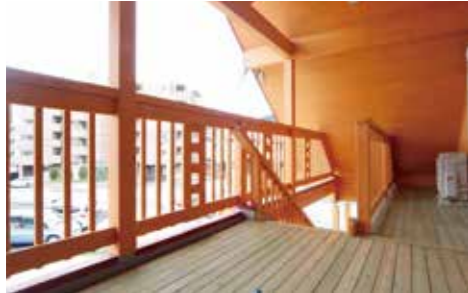
2階デッキを大屋根がかぶる。