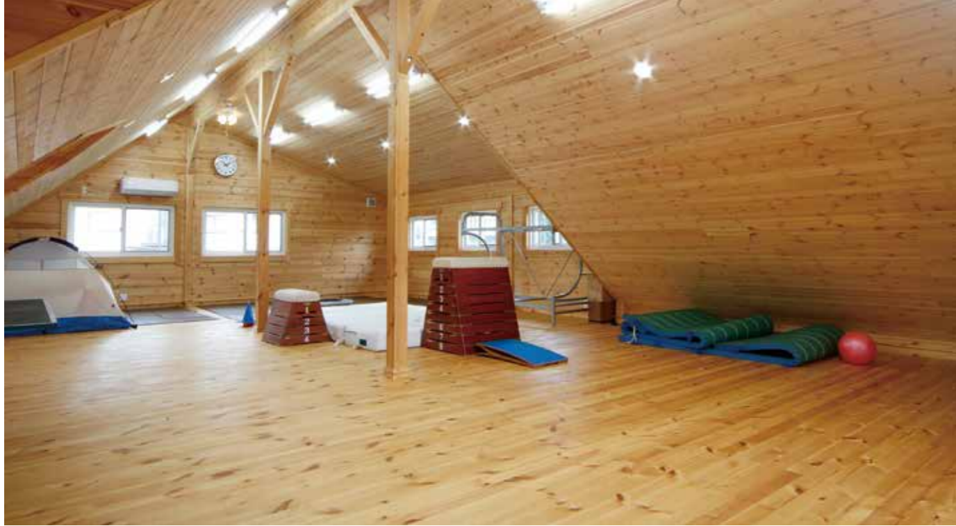
広々とした体操室。ここでは、逆立ち、ブリッジ、跳び箱、かっこなどを練習する。