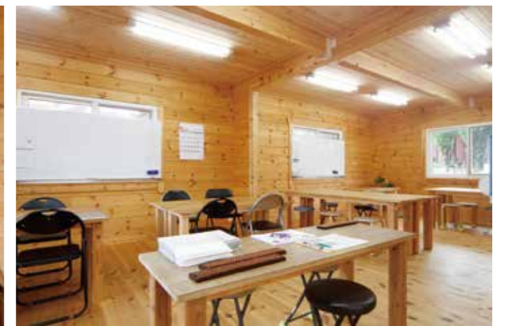
小学校クラスの教室。各学年の子どもたちが一緒になって勉強する。