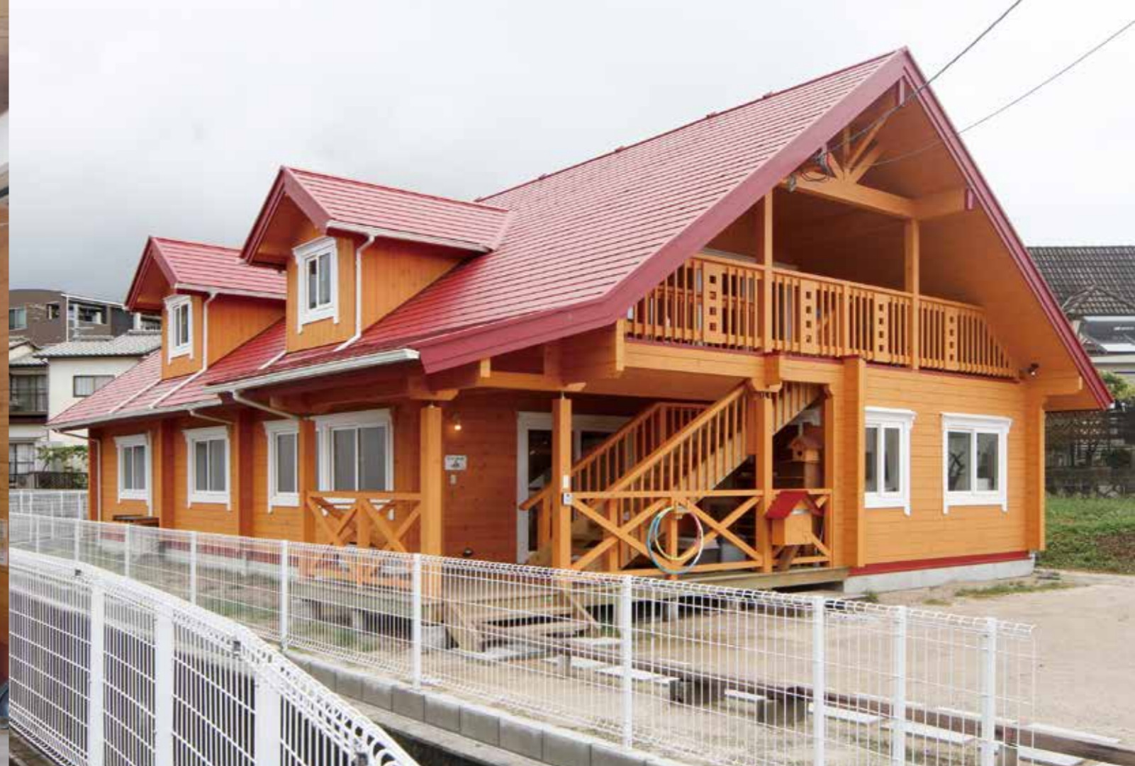
クリムゾンレッドの屋根とドーマー窓。ログハウスの学び舎がベッドタウンに素朴な景観を残す。